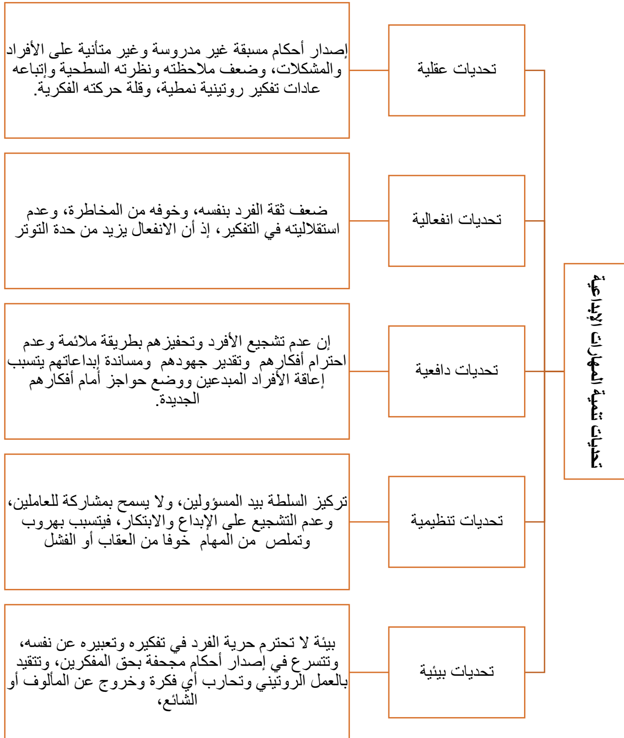
الشكل (3): تحديات تنمية المهارات الإبداعية